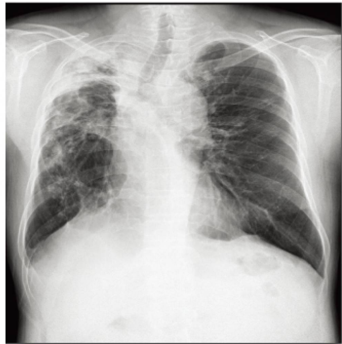
결핵환자 흉부X-선 사진